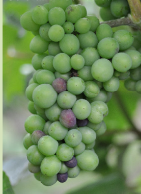
Coloration des baies.

Tordeuses : fin de vol. Pression G2 faible.