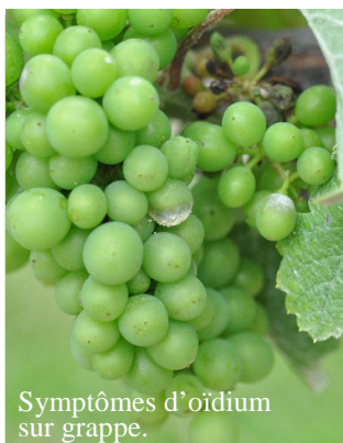
Symptômes d'oidium sur grappe.